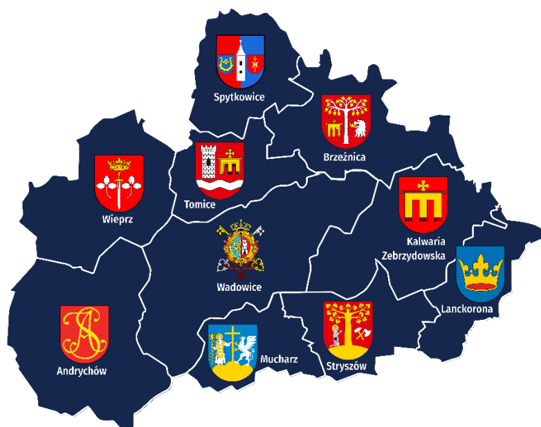
Rysunek 1 Mapa Powiatu Wadowickiego